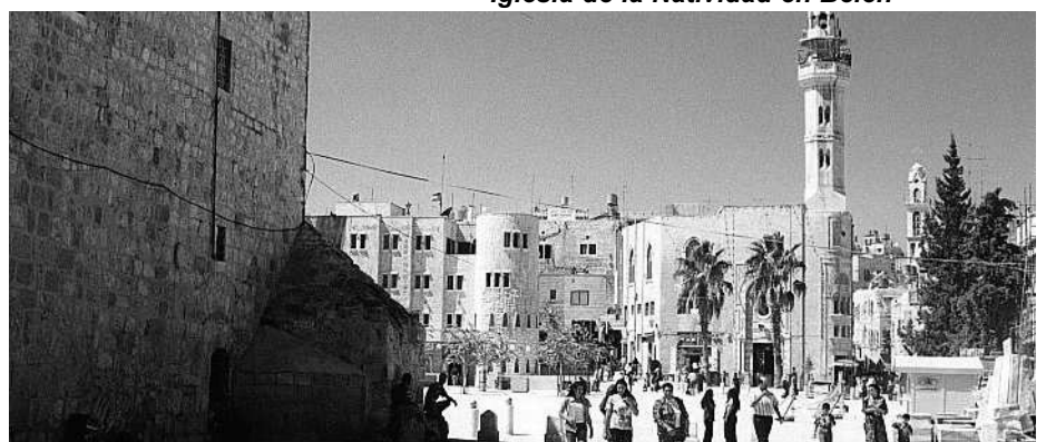
Iglesia de la Natividad en Belén