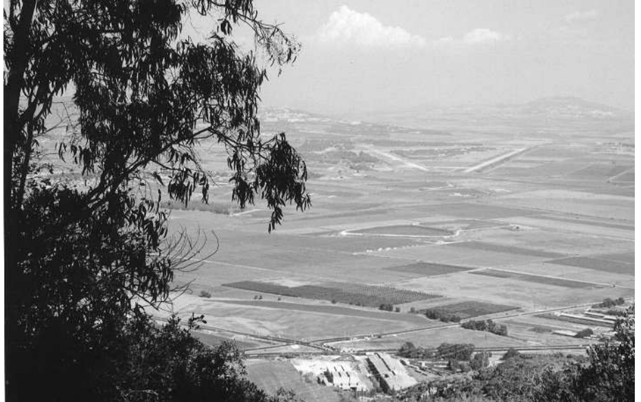
Vista desde el Monte Carmelo

Durante la semana que ha durado la peregrinación a Tierra Santa hemos recibido tres mensajes de móvil desde allí, y a través de ellos hemos podido percibir los sentimien-